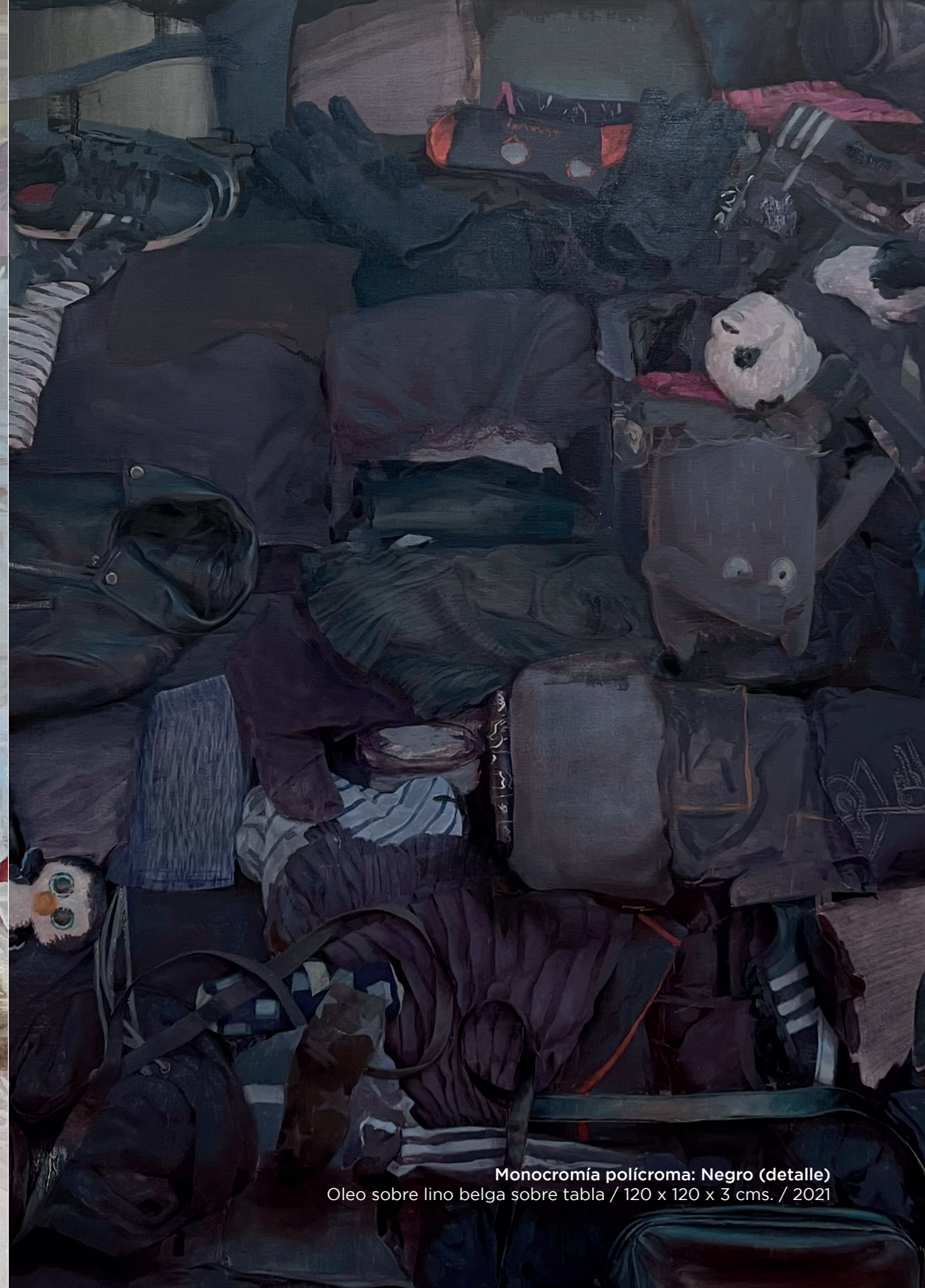
Monocromía polícroma: Negro (detalle) Óleo sobre lino belga sobre tabla / 120 x 120 x 3 cms. / 2021