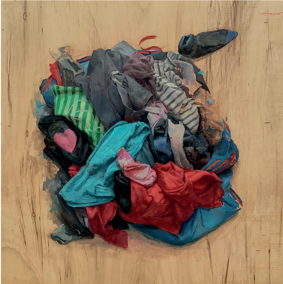
HEAP IV / óleo sobre tabla preparada / 120 x 120 cms. / 2019

Todo comenzó con unos 7 años en esos primeros días de vacaciones de verano donde sobra el tiempo. Alguien decidió que lo ocupara con un cubo de agua, una brocha de encalar y una plancha de amianto. Esa escena de infancia inocente tomó sentido después. No decidí que sería pintora en ese mismo momento, no, pero es sintomático que aún recuerdo el placer que sentí con ese hecho extraordinario: mi cabeza proyectaba, mi mano materializaba y la superficie registraba. Entre la dicotomía del goce del momento y la frustración derivada por la rapidez con la que desaparecían mis trazos por la naturaleza absorbente de la superficie gris, tomé mi primer contacto con la PINTURA .