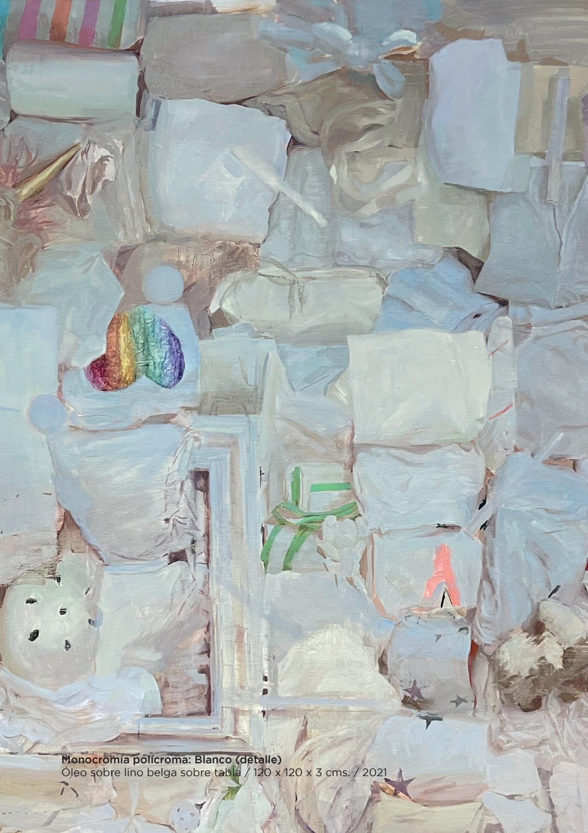
Monocromía polícroma: Blanco (detalle) Óleo sobre lino belga sobre tabla / 120 x 120 x 3 cms. / 2021