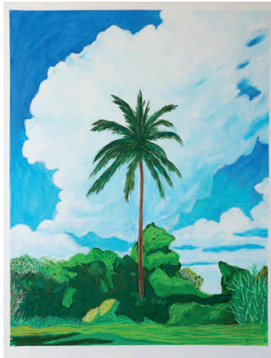
Fernando Batista · Ron del Barrilito, 65 x 50 cms., 2022