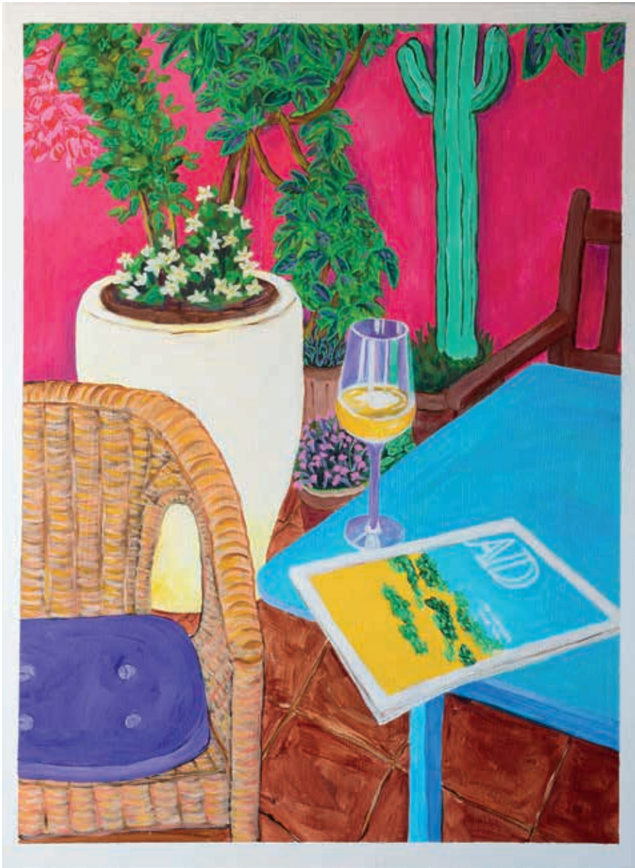
Fernando Batista · El sitio de mi recreo, acrílico sobre lienzo, 80 x 60 cms., 2020