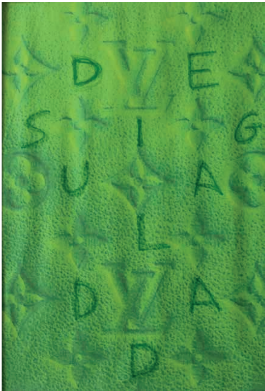
Kike Marín · MCELV2, fotocopia intervenida, 29,7 x 21 cms., 2023